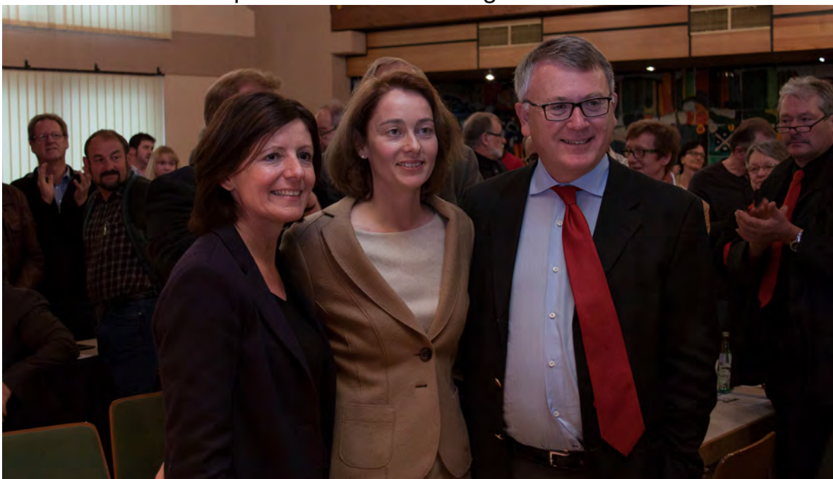
Sozialministerin Malu Dreyer, Katarina Barley, lux. Sozialminister Nicolas Schmit

Damit die soziale Union wieder auf die Agenda gebracht wird, sieht Schmit keine andere Möglichkeit als einen politischen Wechsel in Berlin. Denn nur mit einem SPD-Kanzler ist der europäische Umbruch möglich.