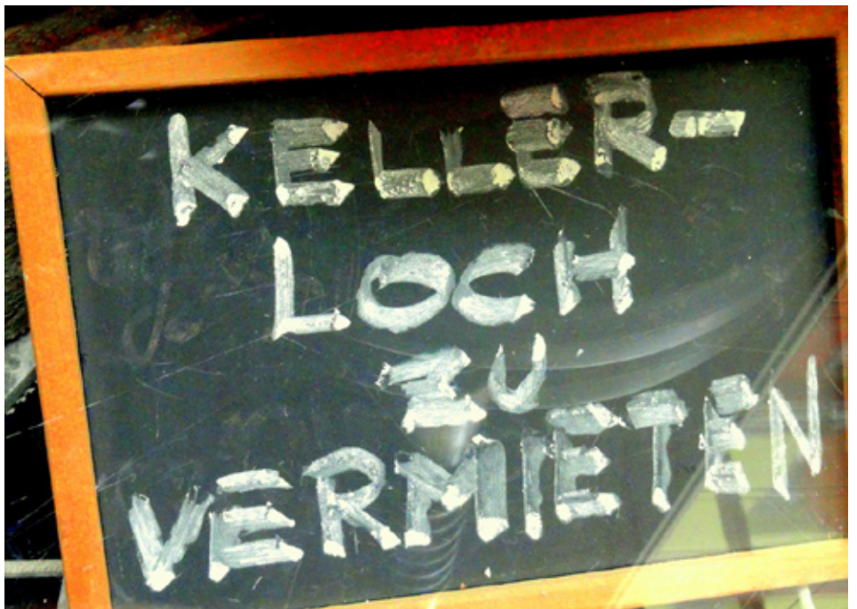
In Ballungszentren ist das allzu häufig Realität: „Kellerlöcher“ zu überhöhten Mietpreisen.

Von besonderer Bedeutung für die SPD und auch zum Beispiel für die Stadt Trier ist das Programm „Soziale Stadt“. Es soll helfen, die soziale Spaltung in arme und reiche Stadtteile zu verhindern. Als Leitprogramm im Rahmen der Städtebauförderung sind im Haushaltsentwurf 150 Millionen Euro allein für dieses Programm vorgesehen. Der Bedarf in den betrof-