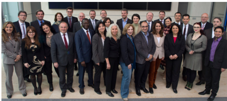
Abgeordnete mit Migrationshintergrund: Noch nie war diese Gruppe so stark im Deutschen Bundestag vertreten.

In den meisten Fällen wird das Aufwachsen in Deutschland von den