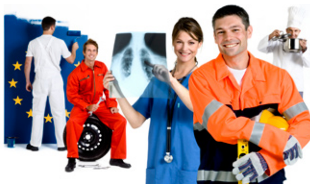
Arbeitnehmerfreizügigkeit in Europa darf nicht zu Sozial- und Lohndumping missbraucht werden - zum Schutze der Arbeitnehmerinnen und Arbeitnehmer

Trotzdem brauchen wir faire Regeln. Es muss klar sein, dass die neue Freiheit nicht zur gezielten Unterbietung der Standards auf dem deutschen Arbeitsmarkt missbraucht werden darf. Für alle müssen in einem fairen Wettbewerb die gleichen Regeln gelten. Die SPD fordert deshalb, dass diese Öffnung von Maßnahmen flankiert werden muss, die allen Arbeitnehmerinnen und